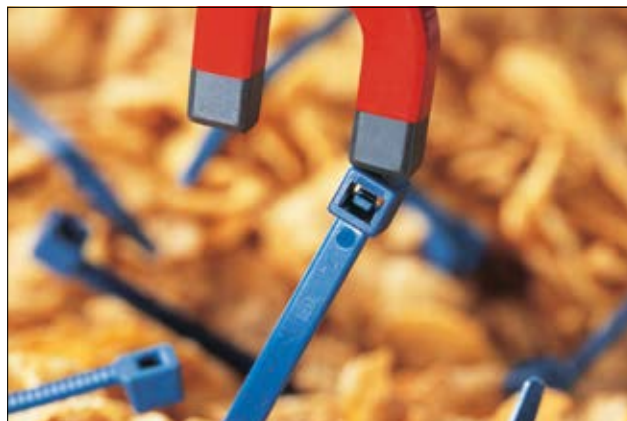
Vores Sporbare MCT(S) anvendes i fødevarer- samt medicinal industrien.